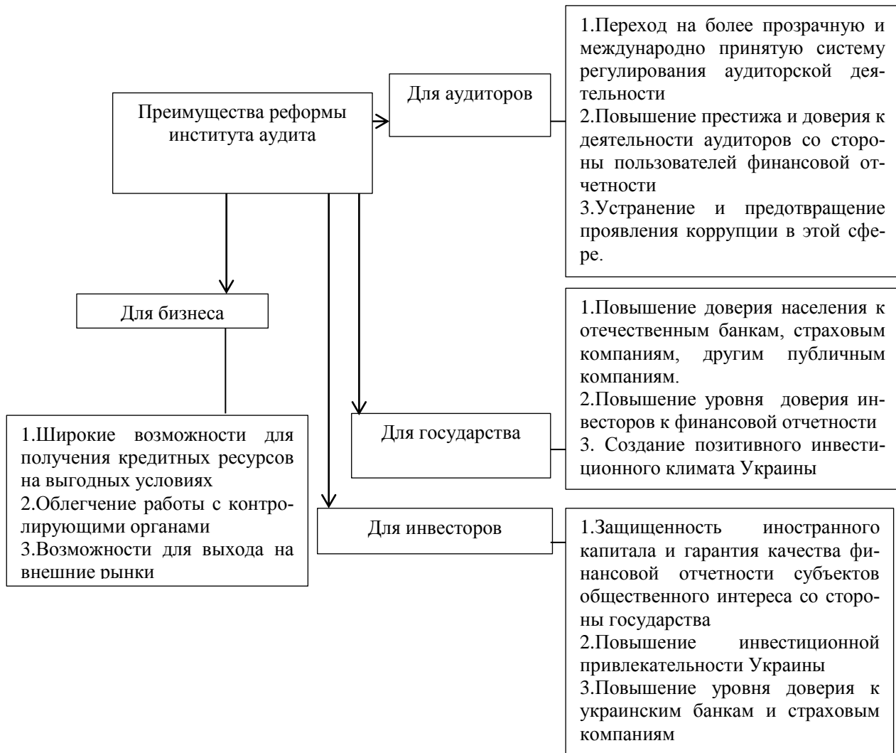
Рис. 3. Преимущества реформы института аудита

Законопроект также предполагает принципиально новую процедуру допуска аудиторов на рынок.